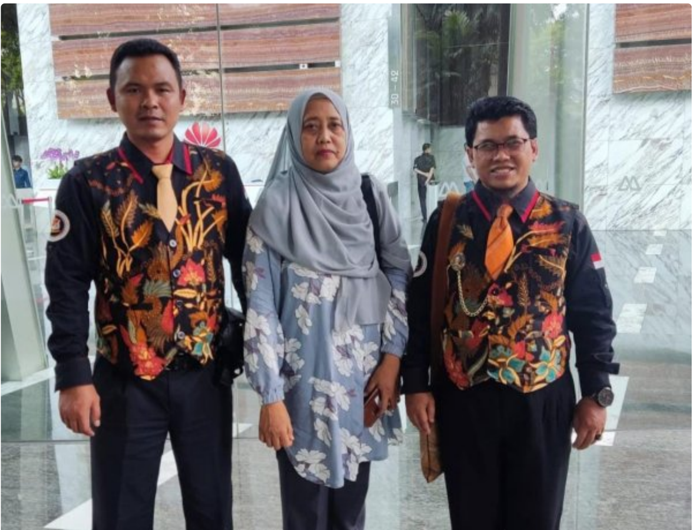
Foto: Tim LIDIK KRIMSUS RI melaporkan dugaan penyimpangan ini ke Komisi Pemberantasan Korupsi (KPK) dan Otoritas Jasa Keuangan (OJK), menuding adanya praktik kotor yang dilakukan oknum PT. Bank Negara Indonesia (Persero) Tbk di Kota Semarang. Senin (04/11/2024).

JAKARTA- Tim Divisi Hukum Lembaga Informasi Data Investigasi Korupsi dan